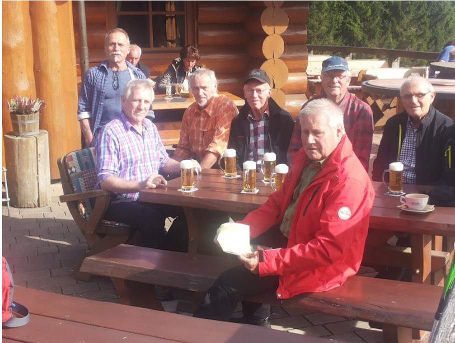
Rast auf 774 m Höhe an der Schwedenhütte

Am 2.Tag machten wir eine Besichtigungstour durch Winterberg, an der Bobbahn und spielten am Fuße der Sommerrodelbahn ein Minigolfturnier.